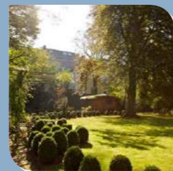
Kontakt Seite 14

„...ein Höchstmaß an Eigenständigkeit und Individualität zu bieten – ganz einfach das gute Gefühl, zu Hause zu sein.“